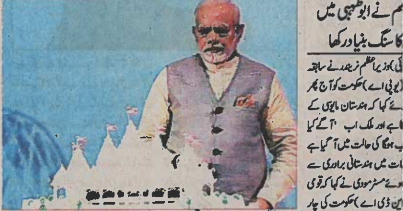
وزیر اعظم نریندر مودی نے ابو ظہبی میں پہلے مندر کا سنگ بنیاد رکھا، تصویر میں مندر کا ماڈل دکھایا گیا ہے۔ وہ دن تھے جب ہم مایوس اور گمراہ تھے لیکن چار برسوں میں صورتحال بدل گئی ہے۔

ہندوستان تو طیت پسندی کے دور سے نکل چکا ہے۔ صورتحال اب کیا ہوگا سے یہ کب ہوگا میں آگئی ہے۔ اس سبب عقین ہو گیا ہے چیزیں تبدیل ہو گئی۔ وزیر اعظم نے ایشیا اور خدمات ٹیکس (سی ایس ٹی) کا ذکر کرتے ہوئے کہا کہ "جی ایس ٹی کا معاملہ سات برسوں سے پھنسا ہوا تھا لیکن اب یہ حقیقت ہے۔ انہوں نے کہا کہ "مالی بینک کی کاروبار میں سہولت والے ملکوں کی درجہ بندی میں ہندوستان 142 سے 100 ویں مقام پر پہنچ گیا ہے (باقی صفحہ 11 پر)